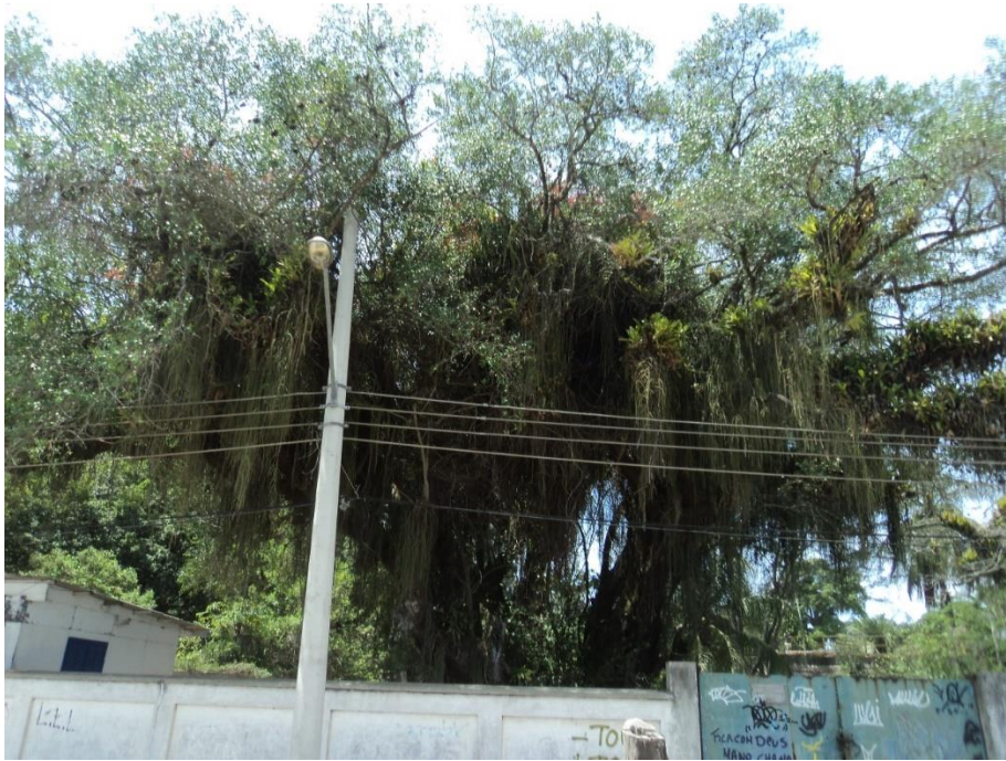
Imagem de fora da CEDAE em 2016

Por ocasião de vistoria de técnicos da FPJ e SMAC em outubro de 2016, verificando como estavam os vegetais imunes da Ilha de Paquetá, esta Quixabeira já tinha sido identificada como uma árvore com potencial para inclusão na Imunidade de corte. Conforme fotos abaixo.