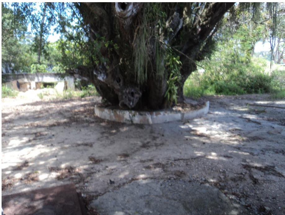
Imagem da base do vegetal em 2016